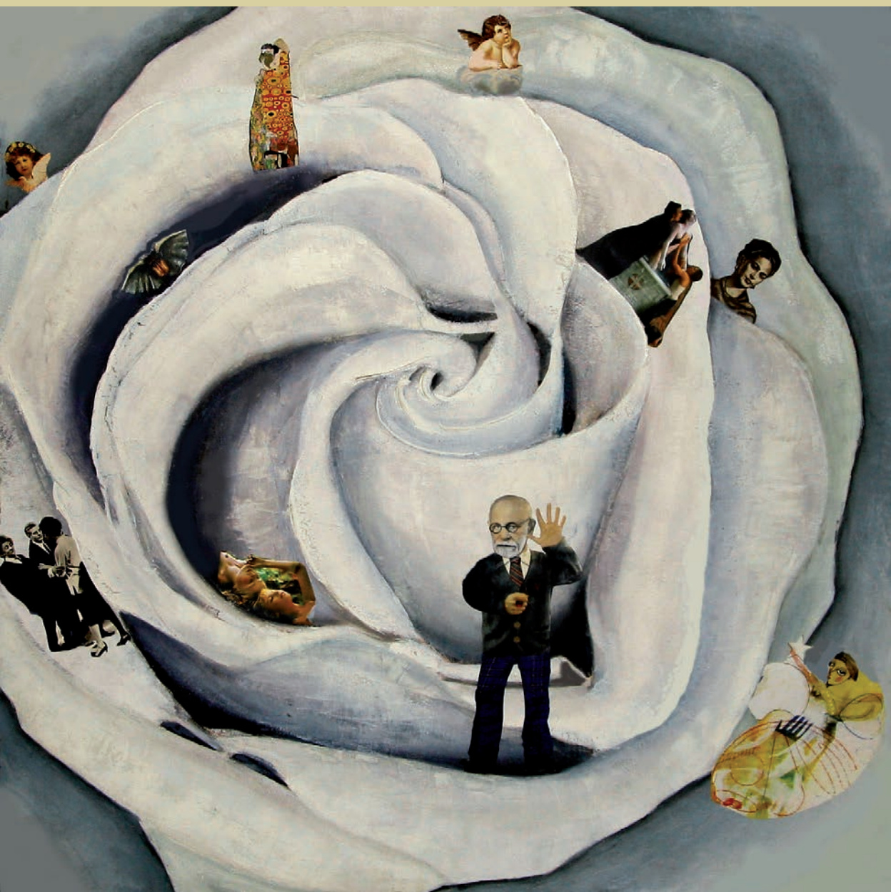
Lilian Ferreyros. Rosa blanca . (Cuadro intervenido, 2020)